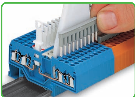
Объединение проходных клемм с фронтальным входом с использованием гребешковой перемычки с помощью 10-конт. рабочего инструмента.